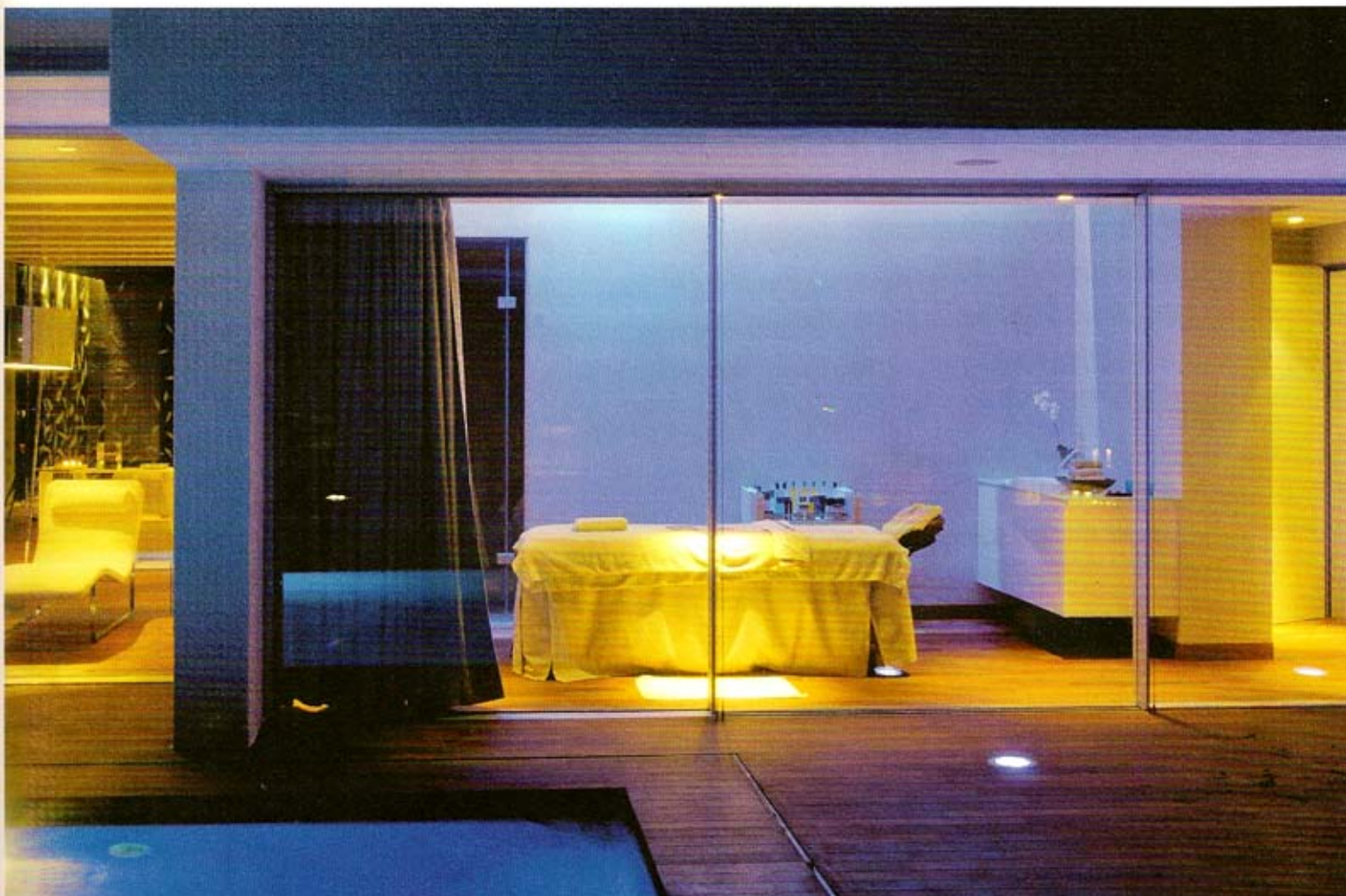
Die Behandlungsräume stehen in engem Kontakt zur Terrasse, Innen- und Aussenraum werden zur Einheit.