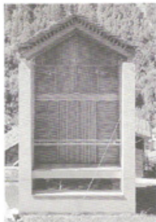
grigliato di rivestimento esterno (Davide Macullo architetto)

rendendole facilmente asportabili dall'acqua e dal vento. Analogamente avviene per le molecole che costituiscono le resine sintetiche addensanti delle verniciature protettive. Anche l'intensità e la quantità delle precipitazioni atmosferiche agiscono sulla durata dei rivestimenti esterni: maggiore è l'acqua assorbita e infiltrata per azione del vento nei capillari del legno, maggiore è la probabilità che alcune specie legnose siano aggredite dai funghi (per esempio le essenze di Pino assorbono umidità in maniera più consistente rispetto all'Abete Rosso, che perciò è più adatto per un utilizzo esterno). Luce, umidità e precipitazioni atmosferiche sono fenomeni connessi tra loro e in grado di alterare l'aspetto e la struttura del legno dando vita a fenomeni di imbrunimento e ingiallimento dovuti alla decomposizione del materiale sottoposto all'azione dei raggi ultravioletti.