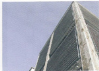
scorcio assonometrico struttura in legno