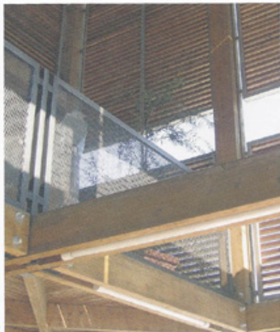
vista dal basso del soggiorno-studio