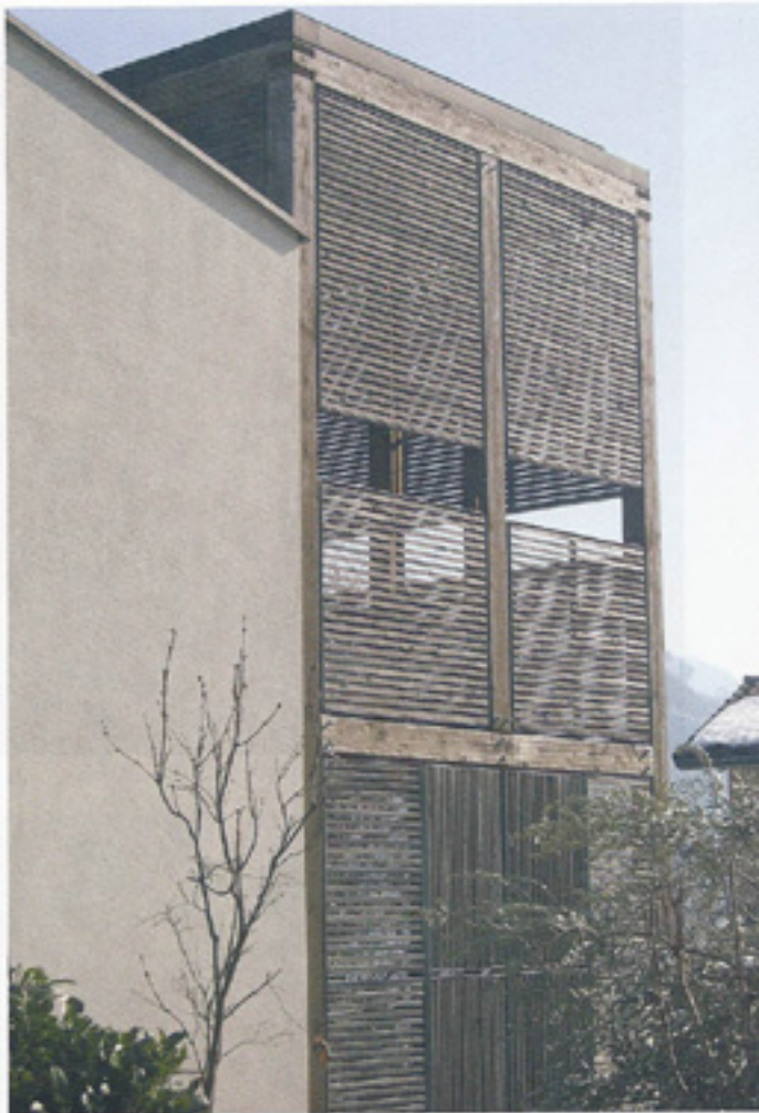
vista prospetto ovest

La necessità di risanare la parte interrata della casa ha suggerito di rivederne le condizioni generali intervenendo in particolare modo sul rapporto aero-illuminante e sulle qualità fisiche della costruzione, pur mantenendo invariata la disposizione interna dei locali.