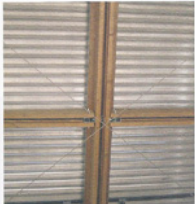
particolare struttura di copertura