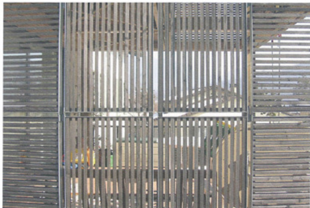
particolare struttura in legno