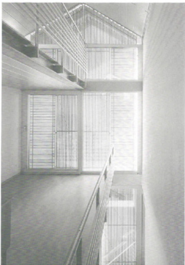
grigliato di rivestimento, vista dall'interno (Davide Mecullo architetto)

La sensibilità diffusa rispetto ai temi riguardanti i contenuti energetici, il consumo e il comfort degli edifici, ha portato alla diffusione di sistemi in grado di intercettare l'irraggiamento solare estivo senza ostacolare la radiazione invernale libera di incidere sulla superficie delle vetrate, funzionanti da sistemi di accumulo passivo dell'energia solare. Tali sistemi possono essere costituiti o da grigliati realizzati con listelli sottili, meno efficienti da un punto di vista energetico, oppure da lame orientate o orientabili in rapporto alla direzione del sole nelle varie stagioni.