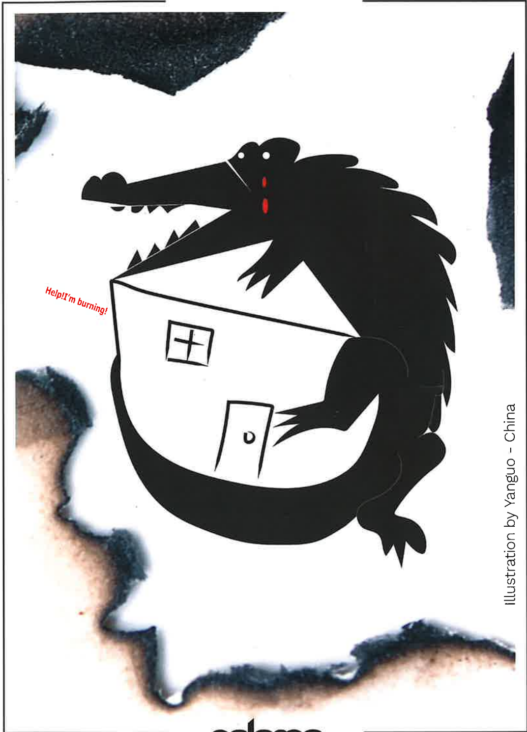
Illustration by Yanguo - China