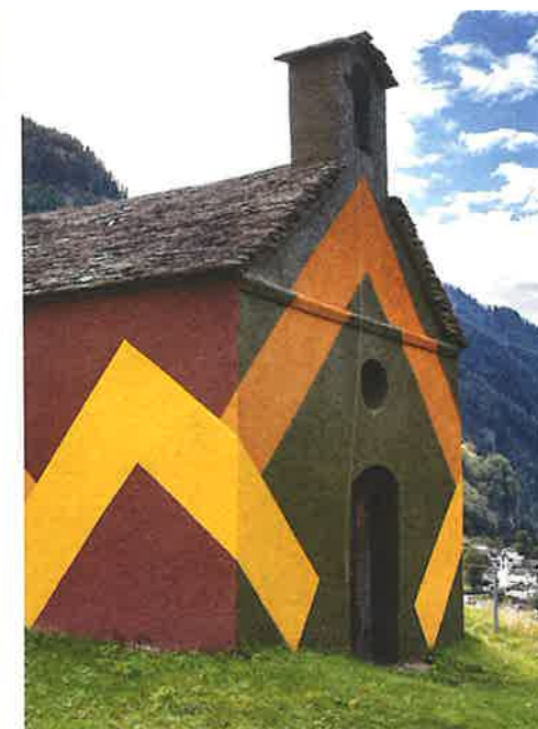
Türme, Kirchen oder Brücken: Das Baumaterial ist immer Stein.